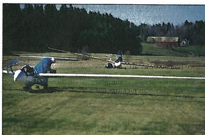
Klubben har ett antal segelflygplan. Utöver det är det många privatpersoner som har egna plan vid flygfältet.

- Jag har en beroendepersonlighet och det tar sig uttryck i träning, bantning, jobb eller vad som helst. Det är inget jag skäms över längre, jag är snarare stolt över att jag vågat ta tag i