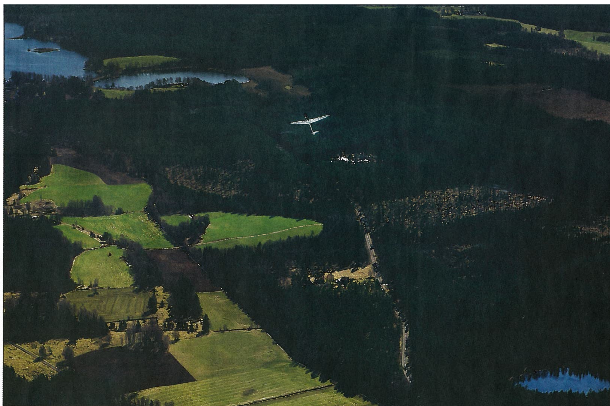
Jorma vänder upp planet i en loop. Just detta plan har en glidkraft på 28 meter på längden på varje meter det tappar på höjden.