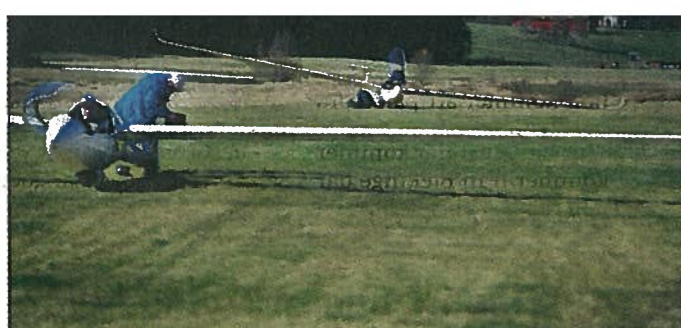
Klubben har ett antal segelflygplan. Utöver det är det många privatpersoner som har egna plan vid flygfältet.